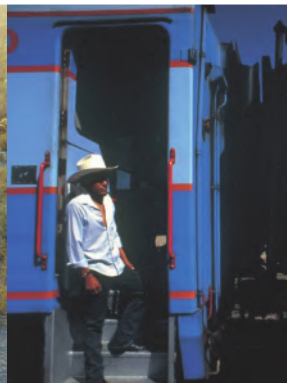
De izquierda a derecha, imágenes de cactus ( Cereus giganteus ), del tren de Barranca del Cobre y de un paisaje, todas en el estado de Chihuahua (México).

ñas en forma de túnel. Mi aspecto de gringo rubio era para ellos una buena carta de presentación, porque prefieren tratar con extranjeros que con los propios mexicanos.