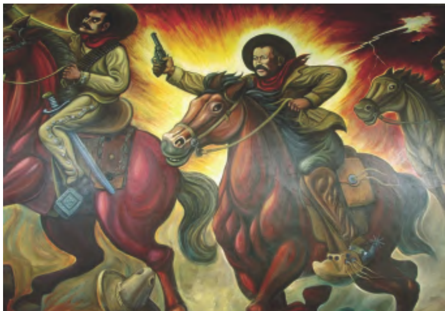
Fresco de Pancho Villa en la Quinta Luz, en Chihuahua (México).

En Sonora y Sinaloa nuestro camino atraviesa grandes plantaciones de tomate, el tomatl azteca, que los españoles tradu-